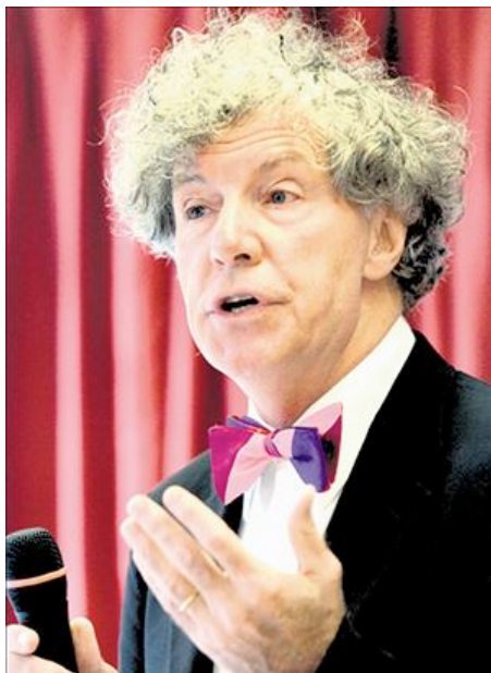
El catedrático de la Universidad de Westminster imparte mañana martes una conferencia en León.

Entre los peligros actuales, ha citado la pérdida de legitimación de los parlamentos en todas las democracias, en las que el sentimiento que reina en los ciudadanos se basa en que éstos "no son útiles".